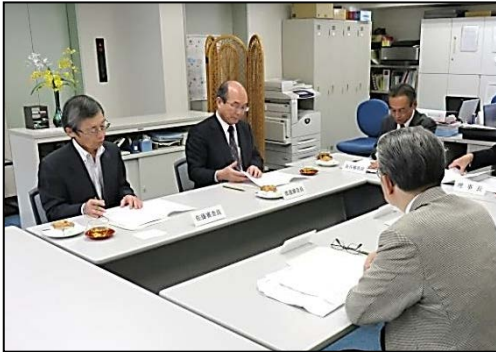
平成27年10月28日(水)開催「助成金審査会審査員打合せ会」風景