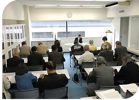
平成27年11月19日(木)開催「地域文化事業助成説明会」風景