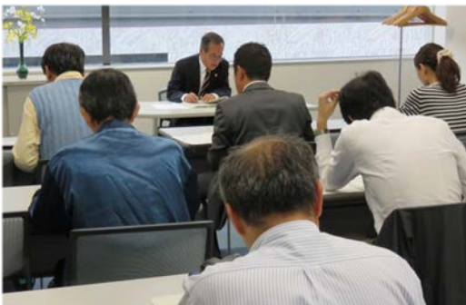
平成27年11月18日(水)開催「社会教育事業助成説明会」風景