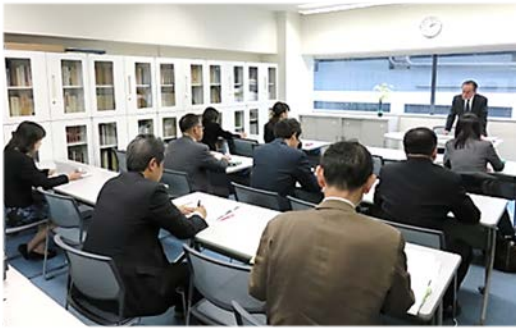
平成27年11月17日(火)開催「学校教育事業助成説明会」風景

展に寄与し、且つ、当該校園の独自性や特色のある事業(一校園当りの助成限度額は予算で定める)